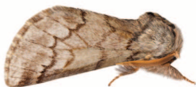
Papillon de la processionnaire du pin