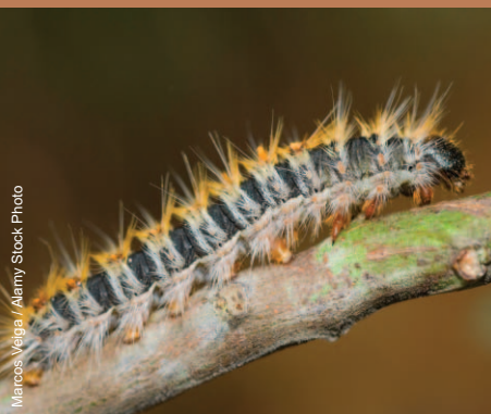
Chenille de la processionnaire du pin

Attention à ne pas confondre la chenille processionnaire avec d'autres espèces de chenilles qui peuvent également se retrouver en nombre sur les chênes ou les pins. Par exemple, c'est le cas de la chenille du bombyx disparate qui se distingue de la chenille de la processionnaire par la présence de paires de taches rouges et bleues sur la partie dorsale et de la chenille du lophyre du pin dont la partie dorsale est dépourvue de poils.