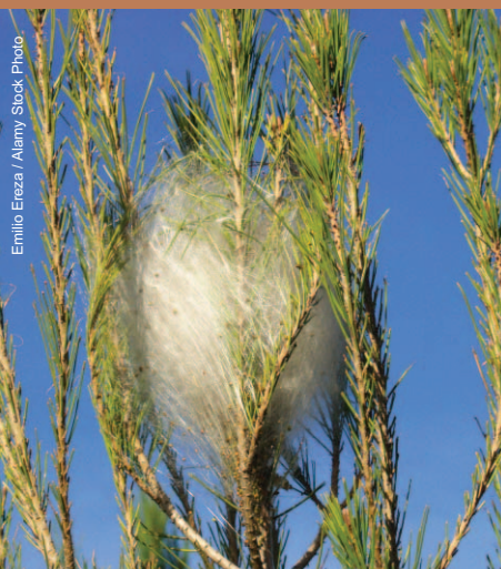
Nid de chenilles processionnaires du pin