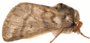
Papillon de la processionnaire du chêne