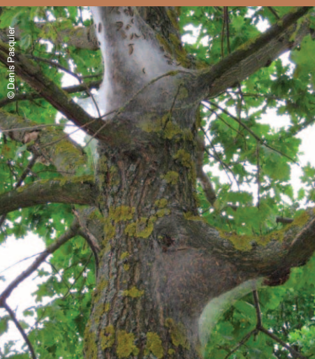
Nid de chenilles processionnaires du chêne