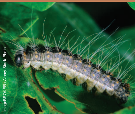
Chenille de la processionnaire du chêne